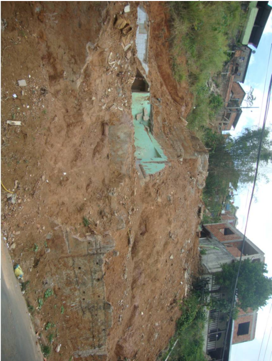
ZUENCO - Documentos LENC - PMR - PMRRE (0009-15) Projeto LENC Bairro Vaquei Oita, N14-4990000754.JPG