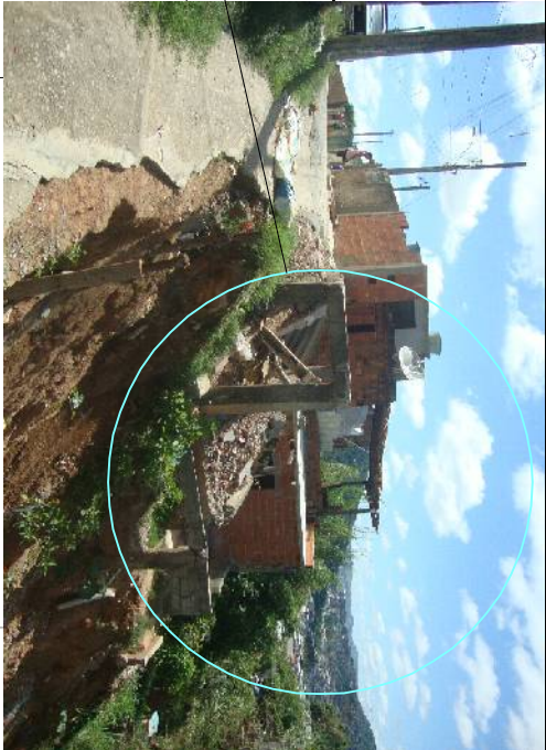
OUTUBRO / 2014